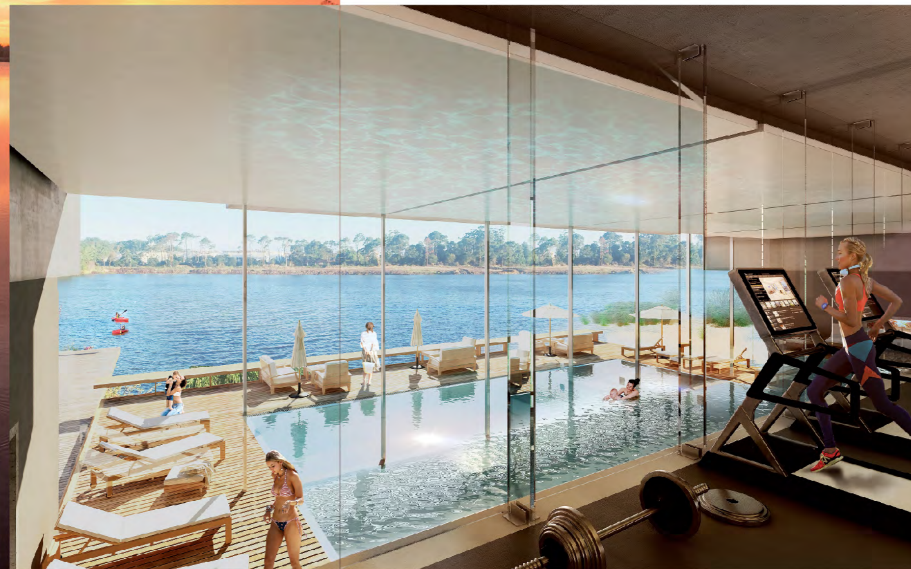
Piscina y gimnasio.