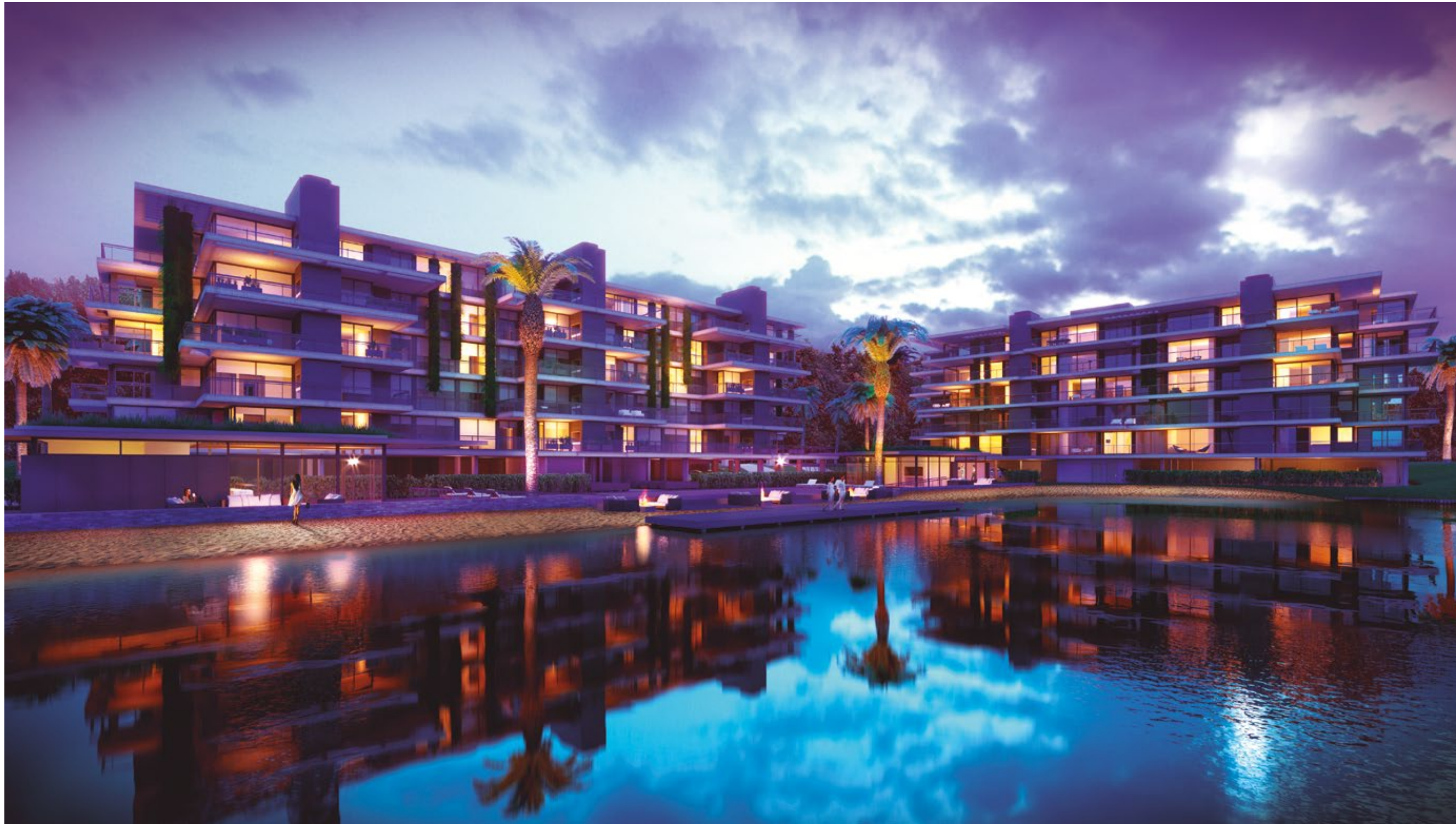
Vista de la piscina junto al lago.

La arquitectura es una pieza clave en la calidad de vida de las personas. Habitar espacios que transmitan paz y bienestar. Que difuminen los límites entre el interior y el exterior. En los que cada detalle sea fundamental: la luz, la presencia de la naturaleza, la paleta de colores, la calidez y nobleza de los materiales. Un diseño que sea una invitación tanto a la contemplación como al disfrute activo.