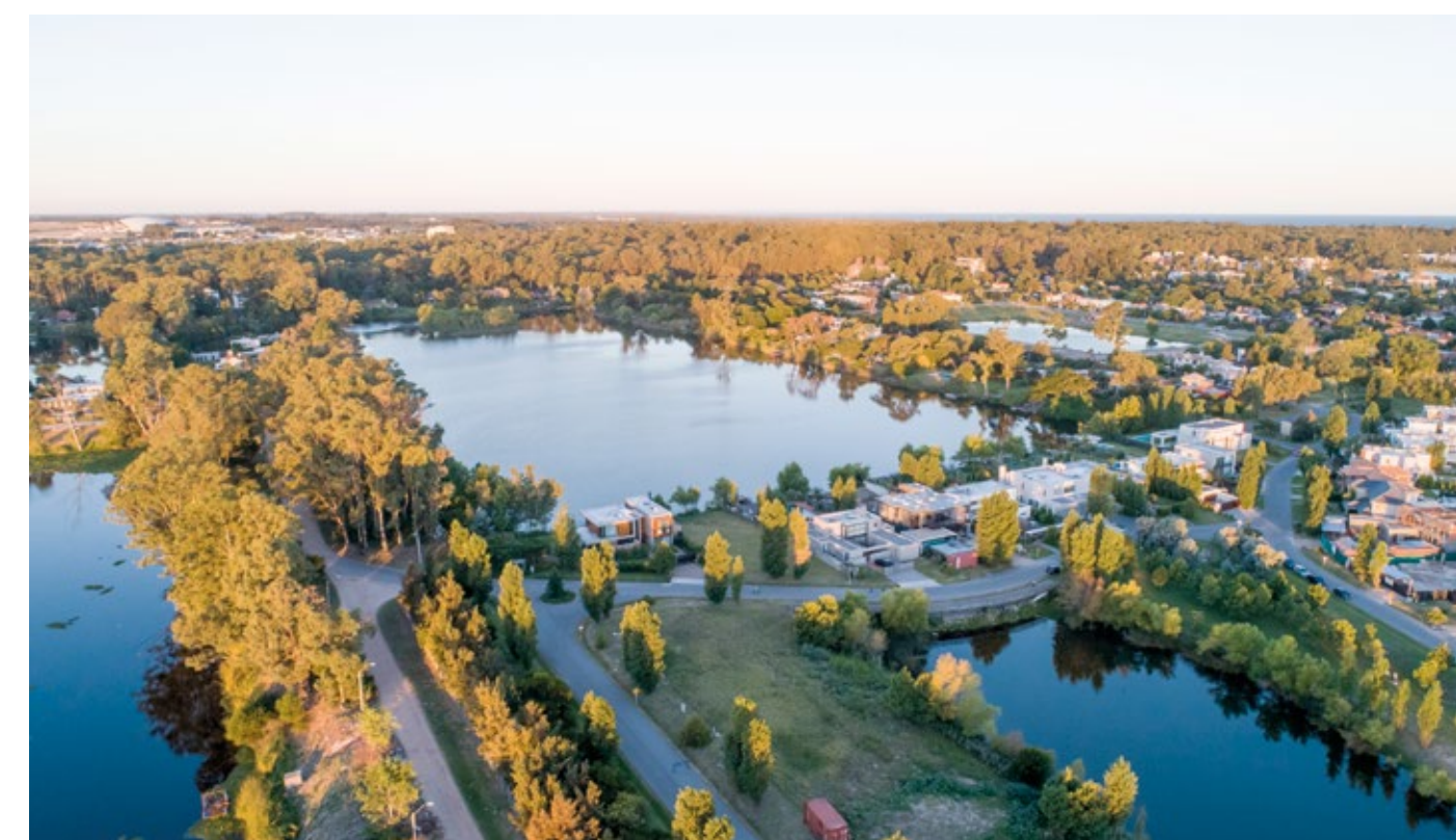
Vista del barrio LAGOS.

El barrio LAGOS provee un entorno y una serie de actividades que se alinean perfectamente con el concepto WELL.