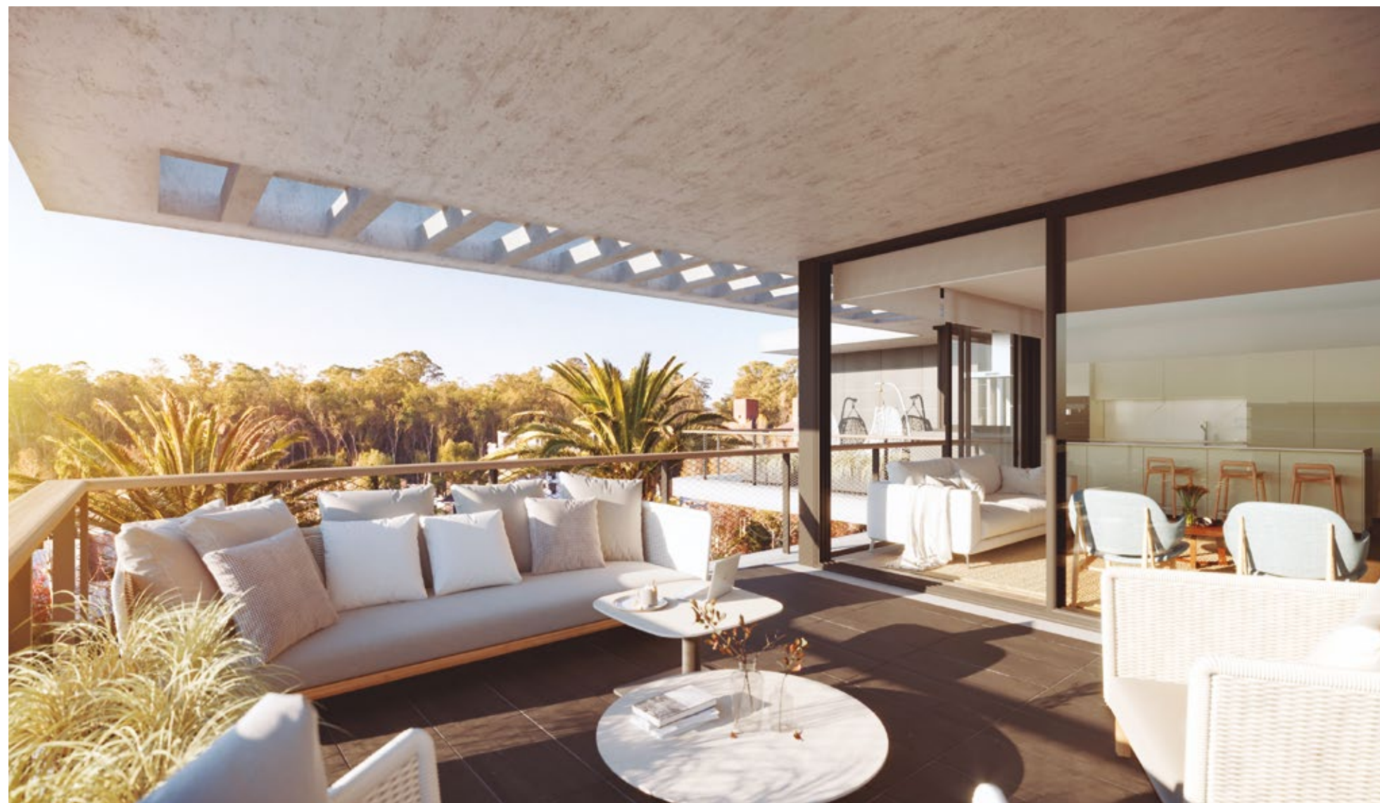
Amplios balcones y ventanas de piso a techo que dotan de gran luminosidad a los apartamentos.

Lo que realmente cuenta son las experiencias. Las vivencias compartidas construyen lazos que nos marcan y nos completan. Esos momentos que nos llenan de satisfacción y que guardamos en nuestra memoria como verdaderos tesoros.