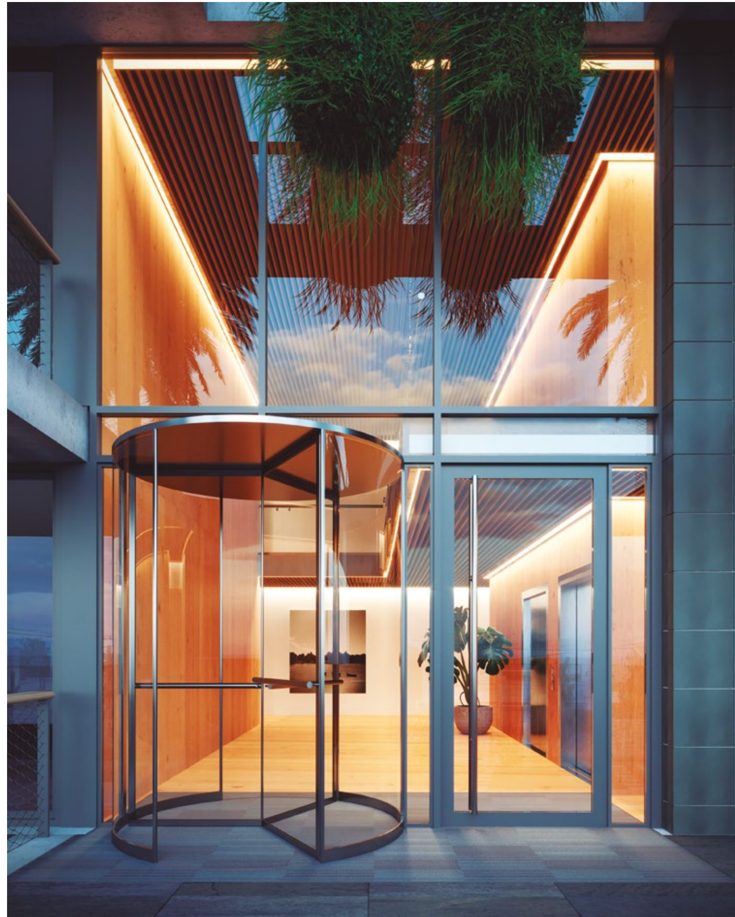
Amplio hall de entrada en WELL II.

Nuestras propuestas son el producto del trabajo colectivo de un equipo multidisciplinario, que reúne a los mejores en cada área. Con proyectos que responden a un mismo concepto: lograr que el diseño, la sustentabilidad y la calidad de vida se integren en soluciones arquitectónicas y urbanísticas de calidad. Con nuevas miradas, imponiendo nuevos paradigmas, atentos a las tendencias y a las nuevas necesidades de bienestar que emergen en la sociedad.