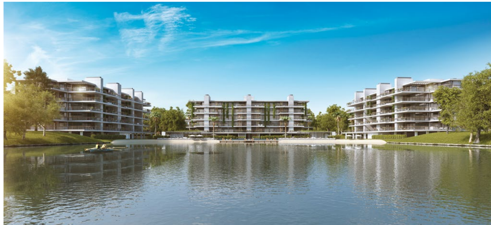
Vista de WELL junto al lago.

El lugar donde vivimos define nuestro día a día y nos determina. Un lugar que nos permita estar activo, cultivar hábitos saludables, disfrutar de un entorno agradable y seguro nos hace estar felices y nos proyecta a una vida más saludable y plena.