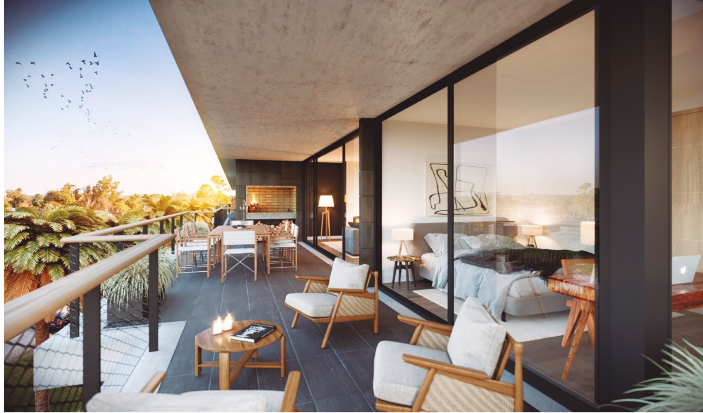
Vista de terraza con parrillero.