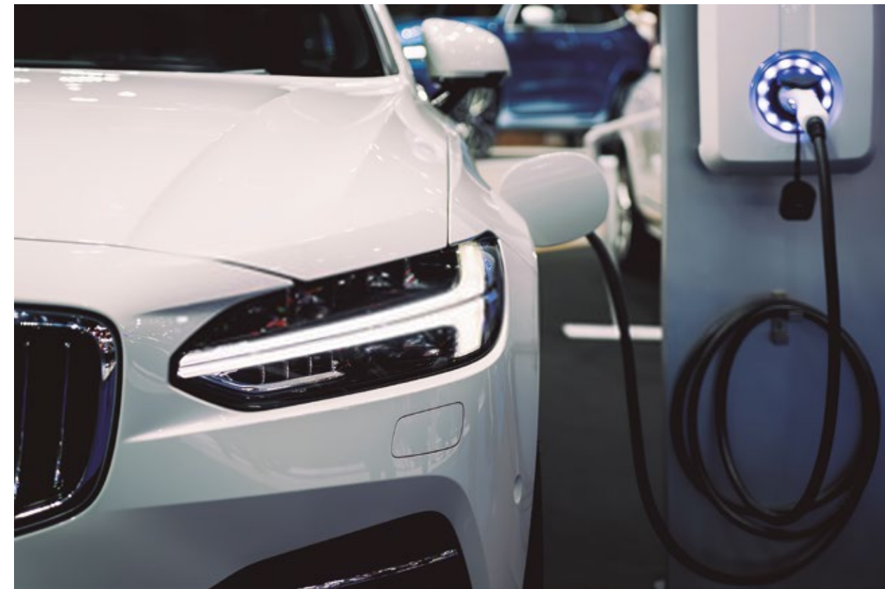
Estación de carga auto eléctrico.