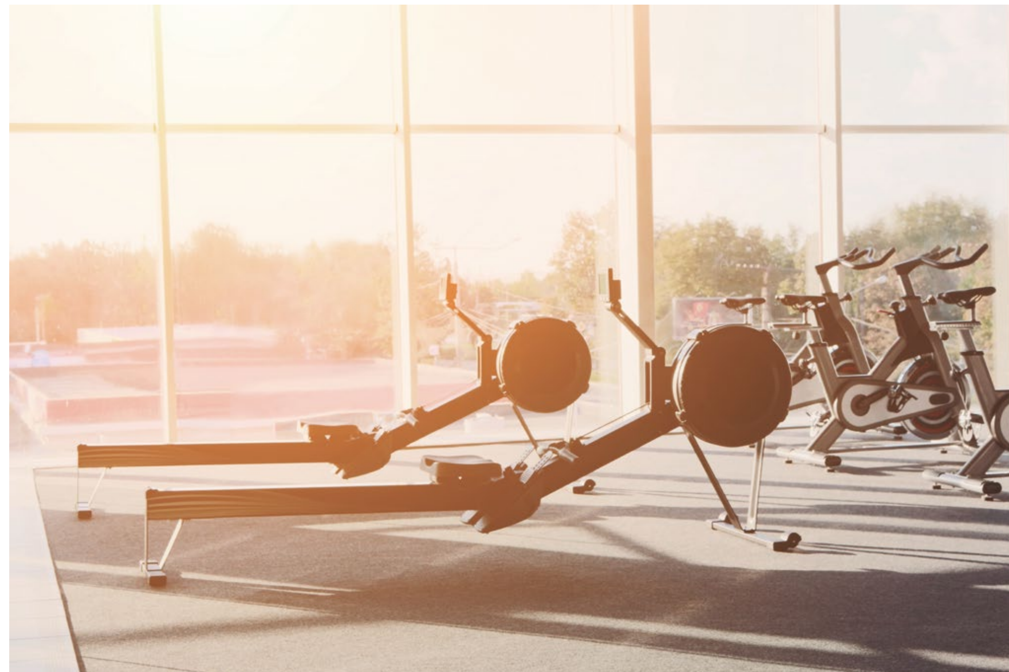
Gimnasio con equipamiento de última generación y vista al lago.